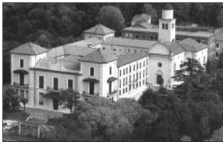
Villa San Fermo Padri Pavoniani, Lonigo (Vicenza) 30 Giugno - 3 Luglio 2021

Relazioni: La musica liturgica Come declamare la Parola nella Liturgia Canto: Esercitazioni corali, Canto gregoriano, L'arte del salmodiare